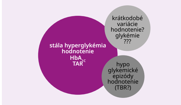
Schéma 2 | Vzájomná prepojenosť jednotlivých súčastí dysglykémie pri diabetes mellitus

TAR – hladina glukózy v krvi nad pásmom dobrej kompenzácie/Time Above Range TBR – hladina glukózy v krvi pod pásmom dobrej kompenzácie (v hypoglykemickom pásme)/Time Below Range